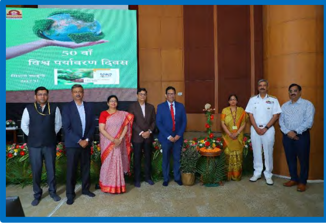
Figure-7 (World Environment Day)