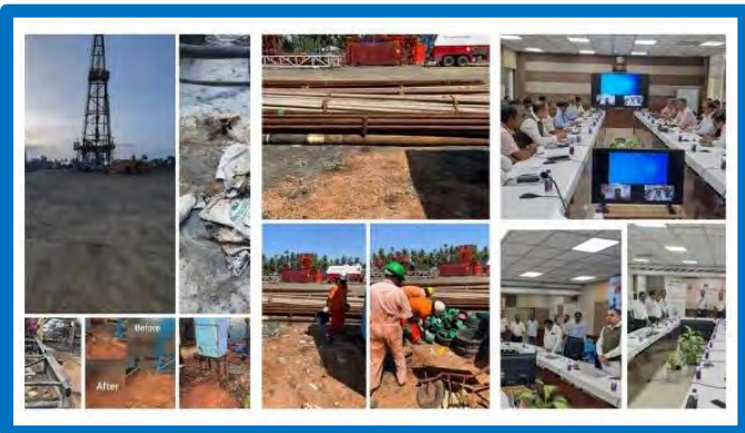
Figure-12 (Swachhata Pakhwara activities during ESA)

OISD officers carried out various activities to spread the message of Swachhata during External Safety audit viz. cleanliness drive at ONGC Rajahmundry asset, Plantation of 50 nos. saplings at BPCL's New Bokaro Depot, Waste management programme at IOCL, Raipur Swachhata awareness program at CS 3 installation near Suryapeta, Telangana etc.