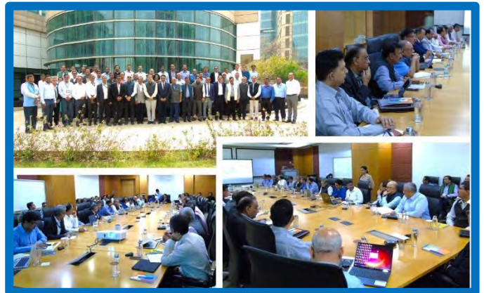
Figure-3 ( 59 th Steering Committee Meeting)