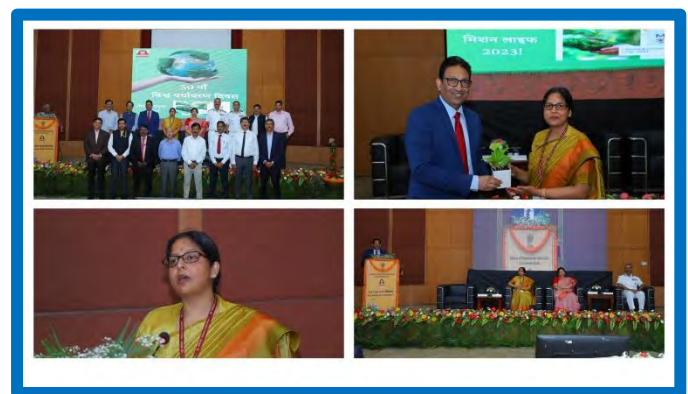
Figure-4 ( विश्व पर्यावरण दिवस )

विश्व पर्यावरण दिवस -2023 के दौरान, तेल और गैस उद्योग की नेट जीरो पहल, पर्यावरण स्थिरता और प्रभाव, और अपतटीय पर्यावरण प्रबंधन पर 3 सत्र थे। इसमें उद्योग के विशेषज्ञों ने भाग लिया। कार्यशाला में कुल 95 प्रतिभागियों ने भाग लिया।