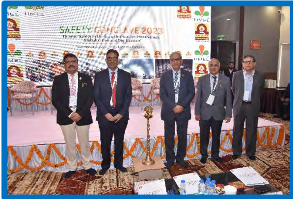
Figure-8 (1. Safety Conclave)

OISD in association with H MEL has successfully organized a "Safety Conclave-2023" on 4th and 5th December 2023 at Bathinda, Punjab which was attended by 128 participants from Oil & Gas industry.