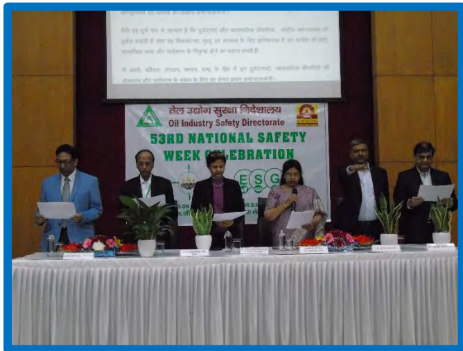
Figure-9 (National Safety Week)

सप्ताह के दौरान आयोजित विभिन्न गतिविधियों में सुरक्षा प्रतिज्ञा, ओआईडीबी भवन के सभी अधिकारियों, कर्मचारियों और संविदा कर्मचारियों के लिए एक स्वास्थ्य शिविर, डीजीएच से अग्नि और सुरक्षा विशेषज्ञ द्वारा अनुबंधित कर्मचारियों को अग्नि सुरक्षा प्रशिक्षण, संविदा कर्मचारियों के लिए पोस्टर प्रतियोगिता, आंतरिक ज्ञान साझा सत्र, ओआईएसडी कार्यालय का सुरक्षा निरीक्षण, ओआईएसडी के विभिन्न वर्गों के लिए आंतरिक सुरक्षा प्रश्नोत्तरी आदि।