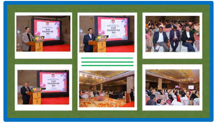
Figure-13 (OISD Foundation Day)

38th OISD foundation day was celebrated on 10th Jan.'24. ED-OISD addressed the gathering. Ex-OISDIans shared their views and experiences. Video on "Journey of OISD was showcased followed by a cultural program.