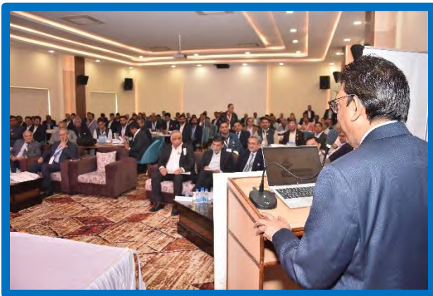
Figure-8 (2. Safety Conclave)