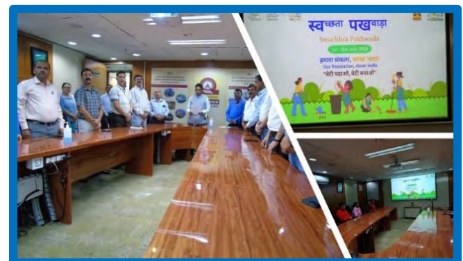
Figure-10 (स्वच्छता पखवाड़ा)

स्वच्छ भारत मिशन के प्रति प्रतिबद्ध, ओआईएसडी ने स्वच्छता पखवाड़ा समारोह के दौरान 3 जुलाई, 23 से विभिन्न गतिविधियों का आयोजन किया, जैसे स्वच्छता प्रतिज्ञा के साथ उद्घाटन समारोह, अनाथालय के बच्चों के लिए स्वच्छता वार्ता और प्रश्नोत्तरी, ग्रामीण क्षेत्र में प्रभात फेरी स्वच्छता पर जागरूकता पैदा करने के लिए, मान्यता प्राप्त एनजीओ 'गूज' के माध्यम से जरूरतमंदों द्वारा आगे उपयोग के लिए पुराने उपयोग योग्य कपड़ों का संग्रह अभियान, सार्वजनिक शौचालय सफाई श्रमिकों का सम्मान, ओआईएसडी परिवार के सदस्यों द्वारा "अपशिष्ट से धन सृजन" विषय पर अपशिष्ट सामग्री का उपयोग करते हुए शिल्प कार्य, स्लोगन और कविता प्रतियोगिता, प्रश्नोत्तरी, अप्रयुक्त कागजों की कतरन और पुनर्चक्रण, ओआईएसडी कार्यालय और सामान्य क्षेत्र की गहरी सफाई और पुराने दस्तावेजों और फाइलों की सफाई और पुराने दस्तावेजों के संरक्षण और निपटान के लिए डिजिटलीकरण, "स्वच्छता से सुरक्षा" पर विशेष सुरक्षा संवाद वेबिनार और ज्ञान साझा सत्र आदि।