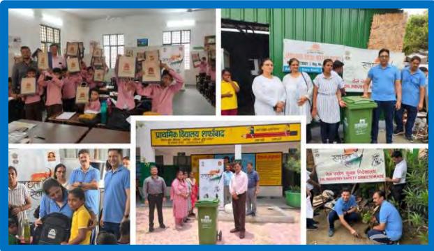
Figure-11 (Swachhata Pakhwara activities)

Committed towards Swachh Bharat mission, OISD organised various activities from 3rd July'23 onwards during Swachhata Pakhwara celebration viz. Opening ceremony with Swachhta pledge, Swachhta talk and Quiz for children of orphanage home, प्रभात फेरी in rural area to create awareness on Swachhta, Collection drive of old usable cloths for further use by the needy ones through recognized NGO 'Goonj', Felicitation of public toilet cleaning workers, Craft work utilizing waste material on theme "Wealth out of Waste" by OISD family members, Slogan & poem competition, Quiz, Shredding and recycling of unused papers, Deep Cleaning of OISD Office and Common area and old documents and files digitization for preservation and disposal of old documents, Special Suraksha Samwad webinar and Gyan Sajha session on "स्वच्छता से सुरक्षा" etc.