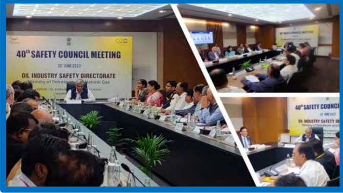
Figure-1 (Safety Council Meeting)