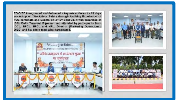
Figure-6 ( 'Internal Auditor' trainings )

OISD conducted 10 nos. of 'Internal Auditor' trainings during FY 2023-24 to enhance 'Auditing Skills' of executives from E&P, P&E, Marketing (POL and LPG) and Pipeline division. A total of 309 internal auditors of various Oil and Gas industries were trained.