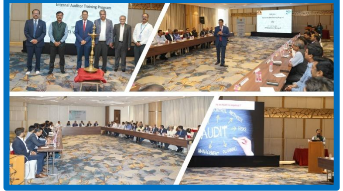
Figure-3 ( 'आंतरिक ऑडिटर' प्रशिक्षण )

ओआईएसडी ने वित्त वर्ष 2024-25 के दौरान 11 'आंतरिक ऑडिटर' प्रशिक्षण का आयोजन ई एंड पी, पी एंड ई, विपणन (पीओएल) और पाइपलाइन प्रभाग के अधिकारियों का 'ऑडिटिंग कौशल' बढ़ाने के लिए किया। विभिन्न तेल और गैस उद्योगों के कुल 252 आंतरिक ऑडिटर्स को प्रशिक्षित किया गया।