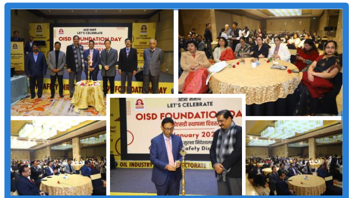
Figure 21 (39वां ओआईएसडी स्थापना दिवस)

OISD celebrated its 39th Foundation Day on 10th Jan'25. The ED-OISD addressed the gathering, and a presentation titled 'Journey of OISD' was shared with the attendees. The event was also attended by former OISDIans and Steering Committee members.