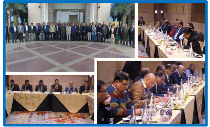
Figure-2 ( 60 th Steering Committee Meeting)