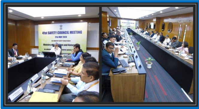
Figure-1 (Safety Council Meeting)