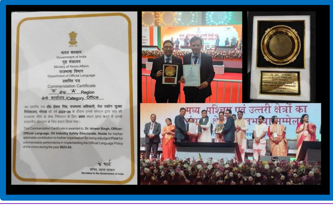
Figure-14 (संयुक्त राजभाषा सम्मेलन)