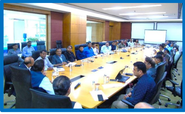
Figure-12 (E&P Knowledge-sharing session)