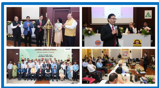
Figure-8 ('Internal Auditor' trainings)