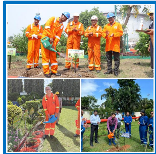
Figure-18 (Tree Plantation activities during ESA)