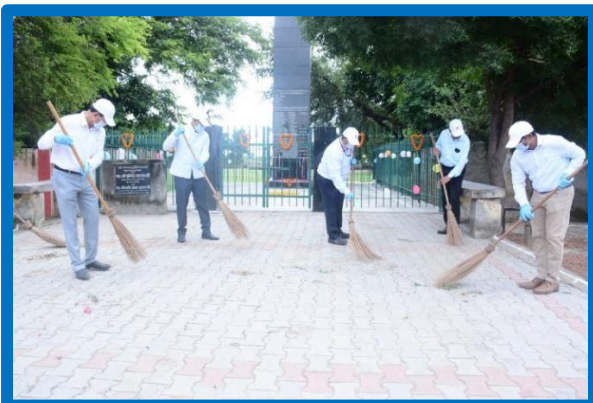
Figure-19 (Swachhta Pakhwara activities)

During External Safety audit, OISD officers carried out various activities to spread the message of Swachhata viz. cleanliness drive at audit locations etc.