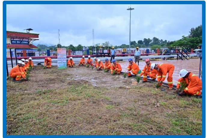
Figure-20 (Tree Plantation)