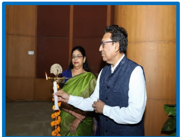
Figure-4 ( विश्व पर्यावरण दिवस )

ओआईएसडी ने 5 जून 2024 को एक पैनल चर्चा और 14 तकनीकी प्रस्तुतियों की विशेषता वाले तीन तकनीकी सत्रों के साथ विश्व पर्यावरण दिवस मनाया। ओआईडीबी, डीजीएच, आईएसपीआरएल, सीएचटी और एचएसएससी के सदस्यों के साथ उद्योग जगत के अग्रणी लोगों ने इस कार्यक्रम में भाग लिया। पैनल चर्चा उद्योग के भीतर स्थायी प्रथाओं और पर्यावरण रणनीतियों पर केंद्रित थी, जबकि तकनीकी सत्रों में नवीन प्रौद्योगिकियों, टिकाऊ ऊर्जा समाधान और पर्यावरण प्रबंधन में सर्वोत्तम प्रथाओं को शामिल किया गया था।