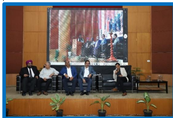
Figure-10 (World Environment Day)