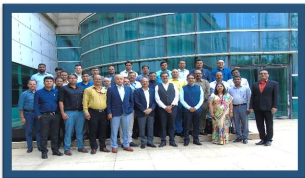
Figure-6 (नॉलेज-शेयरिंग सेशन)

ओआईएसडी के ई एंड पी सेक्शन ने 29 अगस्त 2024 को नोएडा के OIBD बोर्ड रूम में ई एंड पी कंपनियों के साथ नॉलेज-शेयरिंग सेशन का आयोजन किया। सत्र में 12 ई एंड पी कंपनियों के 35 प्रतिभागियों ने भाग लिया। ईडी-ओआईएसडी ने भी सत्र को संबोधित किया।