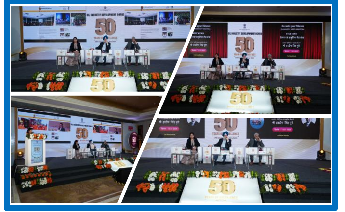
Figure 16 (ओआईएसडी की नई वेबसाइट लॉन्च)

5 मार्च 2025 को निदेशालय का संसदीय राजभाषा समिति की पहली उप समिति द्वारा राजभाषा निरीक्षण किया गया जिसमें कार्यकारी निदेशक के नेतृत्व में निदेशालय का पूरा निदेशक मण्डल उपस्थित रहा। दिल्ली स्थित 12 कार्यालयों के इस निरीक्षण कार्यक्रम का समन्वय निदेशालय को दिया गया था जिसे उसने बखूबी निभाया। संसदीय राजभाषा समिति ने निदेशालय के राजभाषा निष्पादन के लिए 'उत्कृष्ट' प्रमाण पत्र दिया।