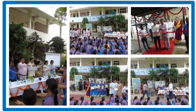
Figure-17 (स्वच्छता पखवाडा)

बाह्य सुरक्षा ऑडिट के दौरान, ओआईएसडी अधिकारियों ने स्वच्छता के संदेश को फैलाने के लिए विभिन्न गतिविधियों को अंजाम दिया, जैसे कि ऑडिट स्थानों पर स्वच्छता अभियान आदि।